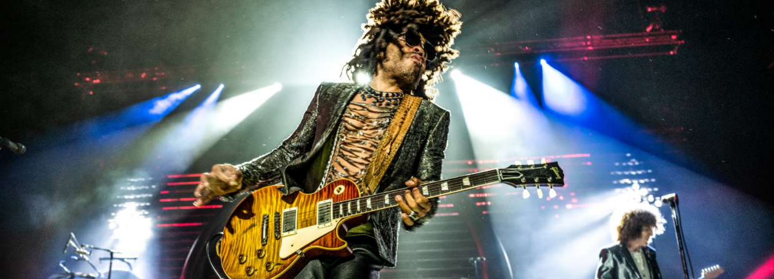
Lenny Kravitz, Zénith Toulouse Métropole, le 19 mai 2019

Depuis 45 ans, Euterpe Promotion et Alhambra Productions se sont imposées comme une référence dans l'organisation d'événements culturels dans le grand Sud-Ouest.